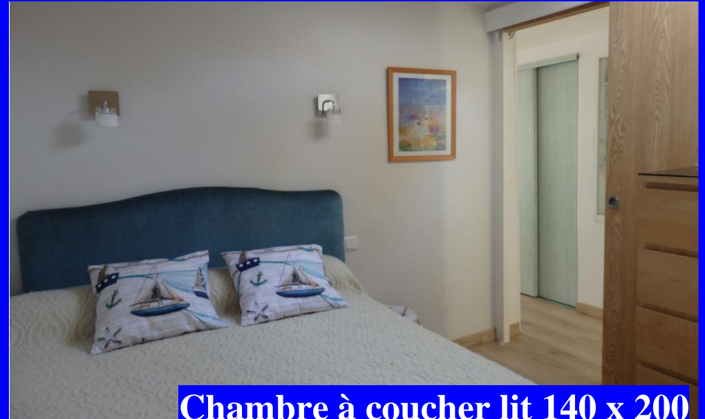
Chambre à coucher lit 140 x 200