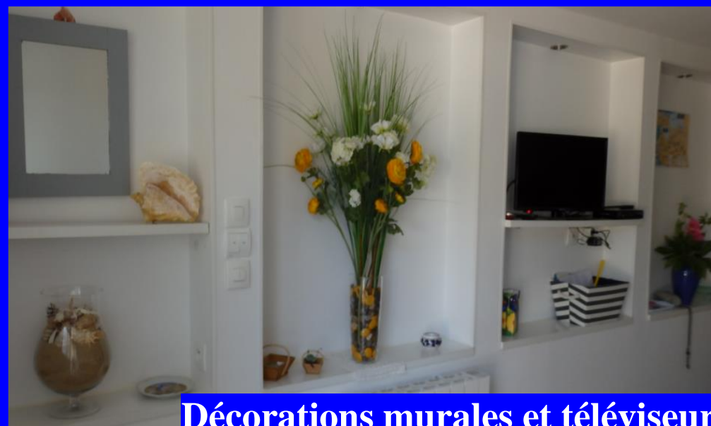
Décorations murales et téléviseur