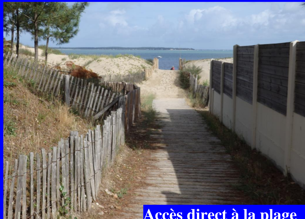
Accès direct à la plage