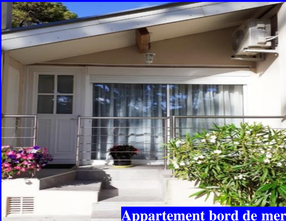
Appartement bord de mer